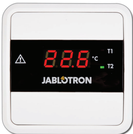
Obrázek 1: Přední pohled

Elektronický teploměr TM-201 lze využít ve všech instalacích, kde je potřeba měřit a zobrazovat jednu až dvě teploty. Tyto teploty jsou zobrazovány na přehledném displeji, kde je pomocí zelených LED zároveň indikováno, ze kterého teplotního snímače je aktuálně zobrazovaná teplota.