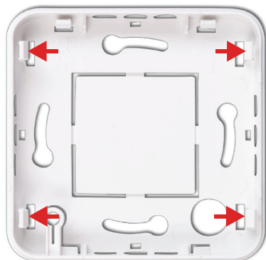
Obrázek 2: Spodní kryt