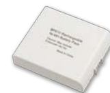
Dobíjecí akumulátor pro kameru