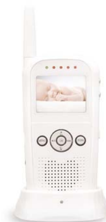
Bezdrátový přijímač Dobíjecí kolébka na přijímač